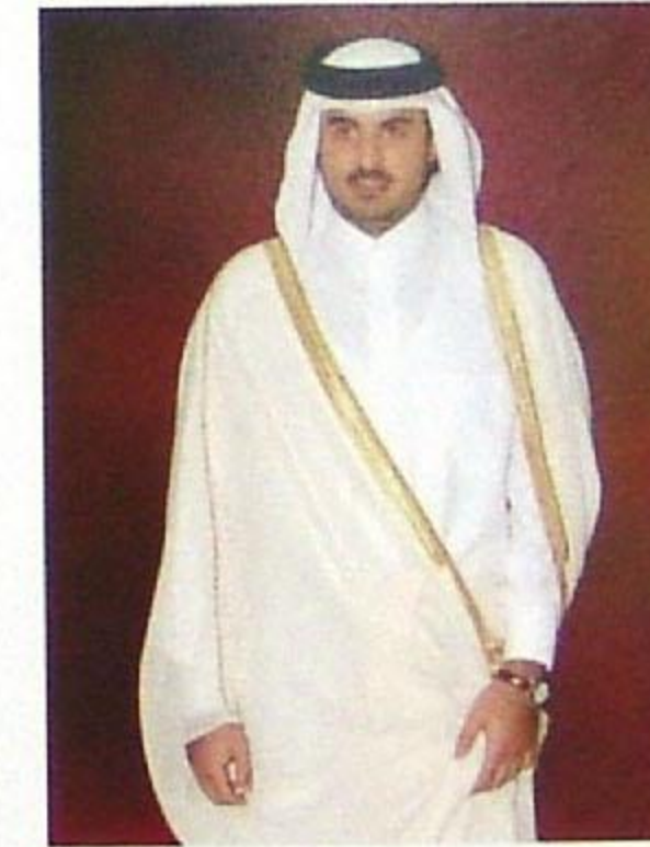
سمو الشيخ تميم بن حمد آل ثاني ولي العهد الأمين